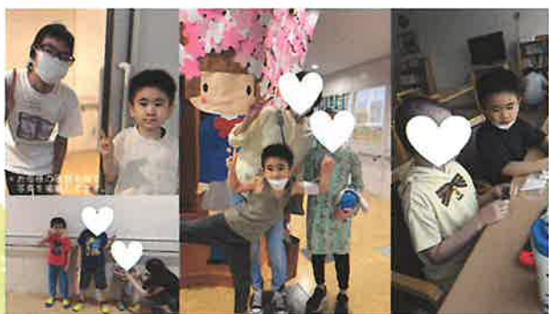
病室の子どもたちと息子

コロナ禍の入院治療生活は、約1年半に及び、その間、息子が「おともだち」と呼ぶ造血幹細胞移植を待つ子どもたちとその親、何組ものご家族との出会いがありました。移植がうまくいき、喜びの退院を果たす親子がいる一方、フルマッチの骨髄ドナーが見つかったと大喜びしたのも束の間、骨髄ドナーがコロナに感染し骨髄提供をしていただけなくなり落胆し悲しみに暮れる親子。移植をしたが、GVHDといった移植後の副作用に苦しむ高校生。2度のさい帯血移植をしたが、生着せずに悲しみの退院をすることになった4歳男児。