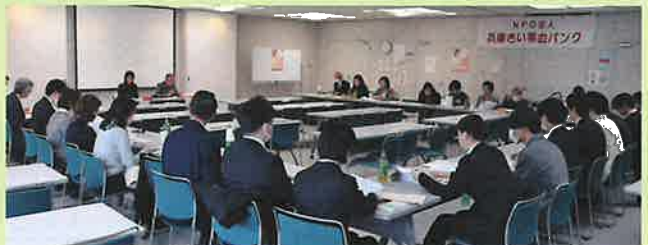
④普及啓発グループ