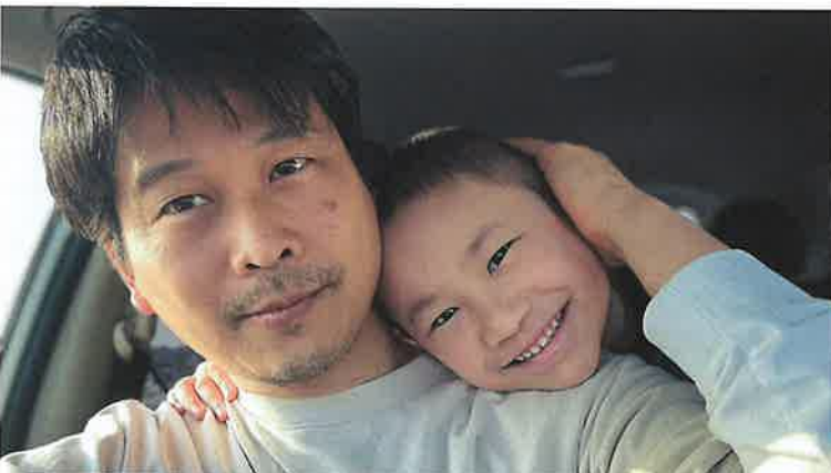
退院後、息子とのツーショット

みなさんの大切な家族が、見知らぬ誰かが提供してくれる「血」に頼らないといけない時は、かなり高い確率でおとずれます。血液製剤の用途の半分は、がん治療です。さらにその癌は、日本人の2人に1人になる。自分自身が癌にならなくとも、大切な家族や友人が癌におかされ、誰かの血に頼らないといけない時が必ず訪れるといっても過言ではないのではないのでしょうか？