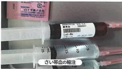
実際に提供を受けた「さい帯血」

患者、患者家族にとって骨髄移植であれ、さい帯血移植であれ、その医療的行為を選択することの恐怖は計り知れないものです。目の前に座る医師、看護師、隣に座る妻の視線を感じ、震えながらボールペンを動かし造血幹細胞移植への同意書にサインをした時のことは鮮明に記憶に残っています。サインをした親である私に「息子のいのち」の全ての責任があるからです。