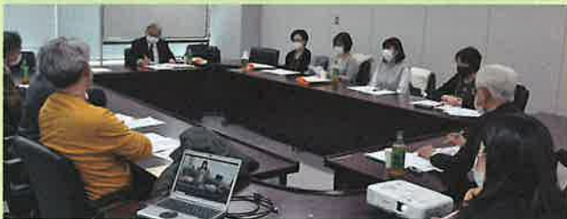
①採取技術グループ