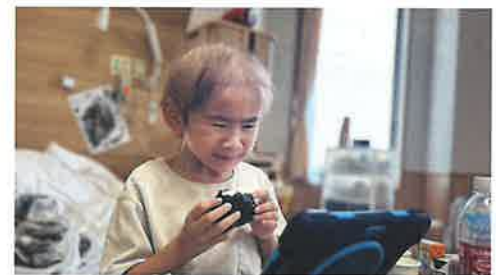
抗がん剤投薬による脱毛

今、行動しておけば、あなた、もしくはあなたの「いのちをかけて守りたい存在」のいのちが未来において救われる可能性が高まる。多くの方がそんな想像をし、この社会課題を捉え、行動していただけたらと願っています。