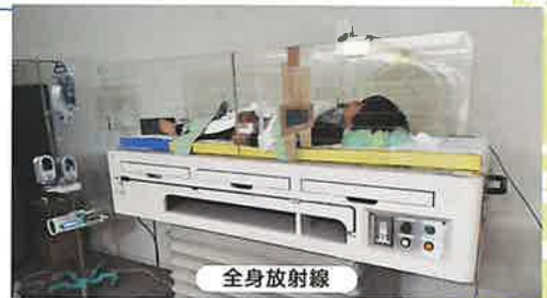
全身放射線を浴びる前の準備

移植に向け眼、肺、全身CT、脳波等、移植による影響を把握するため、検査可能なあらゆる項目の検査を行います。そして、いよいよ“移植前処置”。ここからは引き返せません。全身に放射線を照射、そして抗がん剤を投薬し、一切、血が造られない状態になります。そして提供いただいた“さい帯血”を血液を輸血する時のように輸注するのです。ほんの数ミリリットルのさい帯血が、全身をめぐる何リットルという血液を一生生み出すのです。